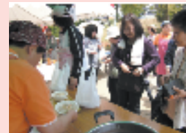
▲定王神社大祭出店