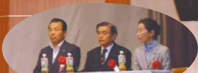
来賓の皆様から挨拶を頂きました

また、会の冒頭では会員事業所にて永年勤続され、多大な功績のある従業員の皆様に表彰状と記念品の授与が行われました。