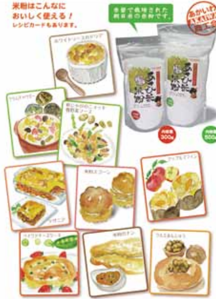
米粉レシピカード