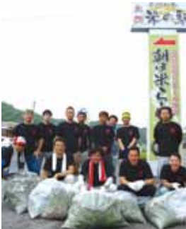
アグリ周辺清掃活動