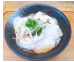
チャーシューメン