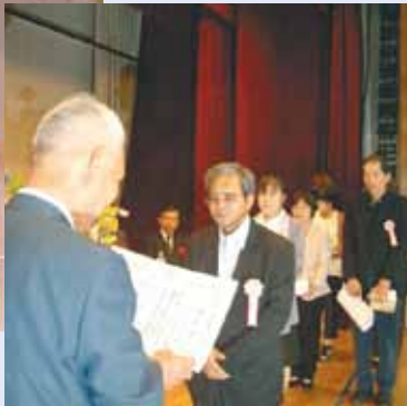
会員事業所に永年勤続された従業員の皆様に表彰状を授与いたしました