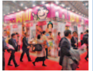
昨年の岡山県ブースの様子

参加条件は赤磐商工会員であり、自社で製造した食品・飲料品を流通に乗せたい方限定です。なお、参加負担金は8万円です。詳しくは商工会のタケナミまで！