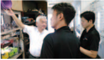
昨年の指導の様子

「5Sって製造業の話！」と思いませんか？いやいやそんなことはありません。製造業・建設業は当然