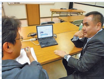
昨年度の講習会の様子です