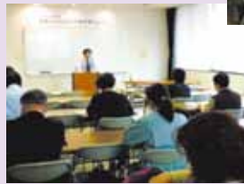
事業主のための 労務対策セミナー