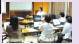
パソコン操作講習会※